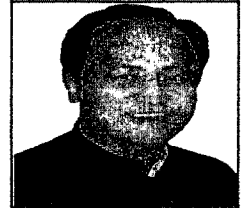
মহিবুল হাসান চৌধুরী, এম.পি.