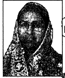
ডা. দীপু মনি এম.পি.